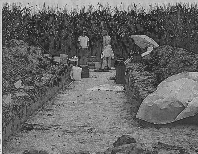
A Körös-vidéken hasonló, középső bronzkori temetőről eddig nem tudtak.

temetkezés nyomaira is rábukkantak, de ezek egyáltalán nem gyakoriak. A Körös-vidéken hasonló, középső bronzkori temetőről eddig nem tudtak, a térségben ez az első ilyen felfedezés.